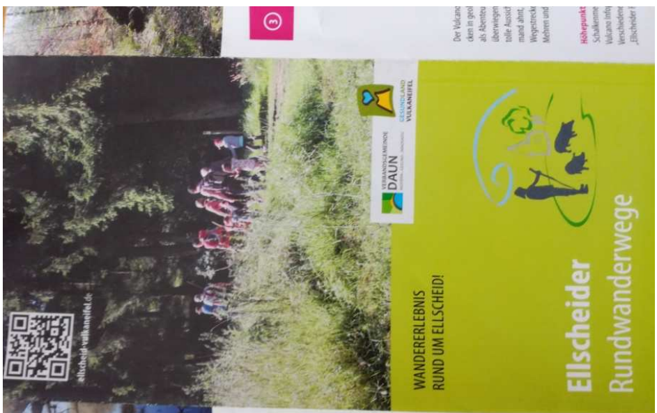
Der neue Wanderwege-Flyer der Ortsgemeinde