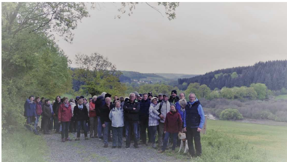
Wanderung am 1. Mai beim Mürmes

Samstag, 23. Juni 2018, ab 18.30 Uhr Vereinshaus