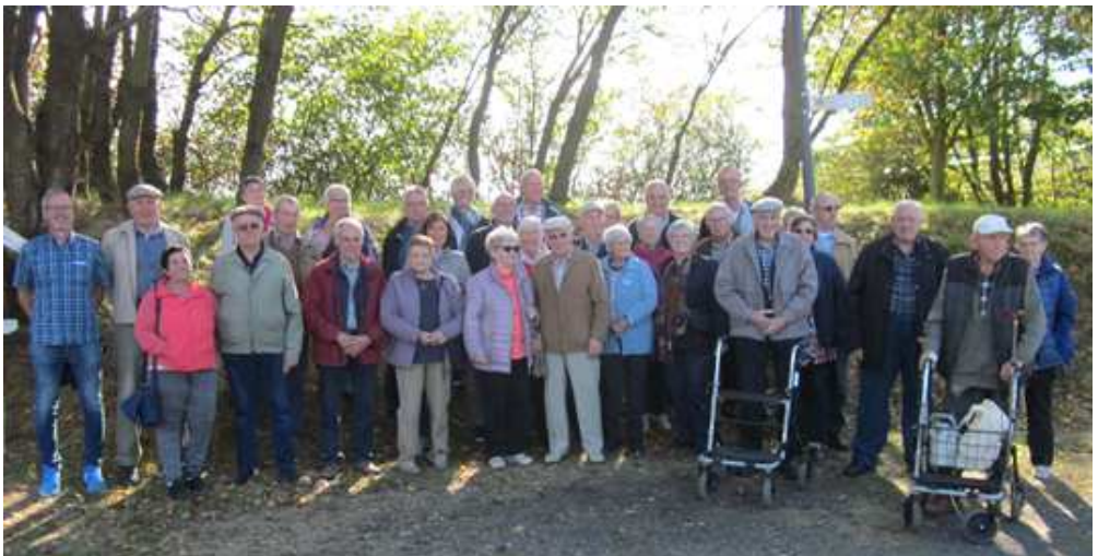
Senioren Ausflug am 4. Oktober 2018 nach Maria Laach und einer Fahrt mit dem Vulkan-Express

Sonntag, 25. November 2018, 14.30 Uhr, Bürgerhaus