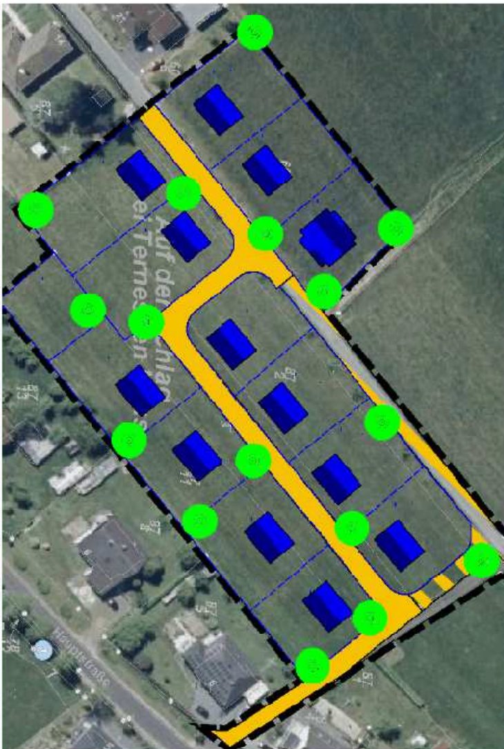
Bebauungsvorschlag Variante 2

Der Ortsgemeinderat hat die Variante 2 mit kleinen Änderungen als Bebauungsplan für das neue Baugebiet 'Auf der Schlag' angenommen.