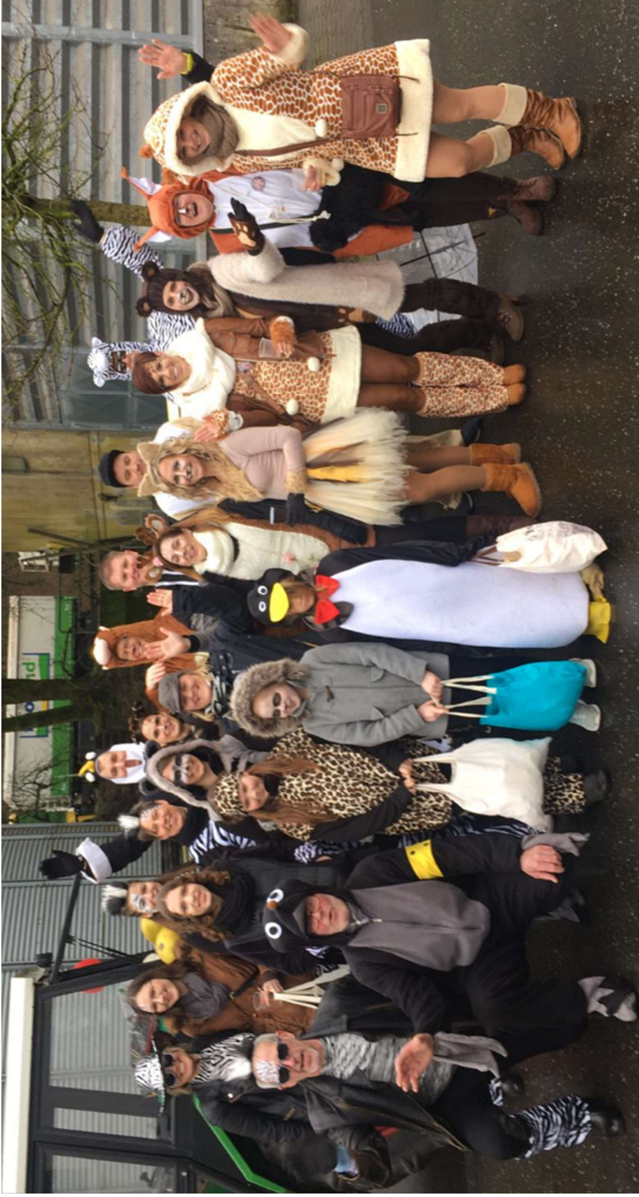
Ellscheider Gruppe beim Rosenmontagsumzug in Gillenfeld